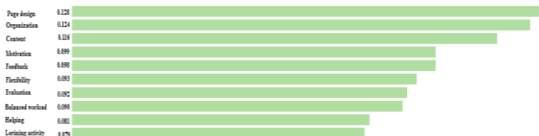
شکل ۲: ارجحیت پاسخ‌ها با توجه به معیارهای برنامه‌های آموزش الکترونیکی

انگیزش: یادگیرندگان باید برای یادگیری انگیزه پیدا کنند. مهم نیست که مطالب درون خطی چه تأثیری دارند، اگر یادگیرندگان انگیزه نداشته باشند، یادگیری انجام نخواهد شد. مسئله این است که خواه انگیزش درونی باشد که از درون یادگیرنده سرچشمه گرفته باشد یا انگیزش بیرونی که از مربی آموزشی و اجرا سرچشمه می‌گیرد. طراحان مطالب یادگیری درون خطی باید از استراتژی‌های انگیزش درونی استفاده کنند.