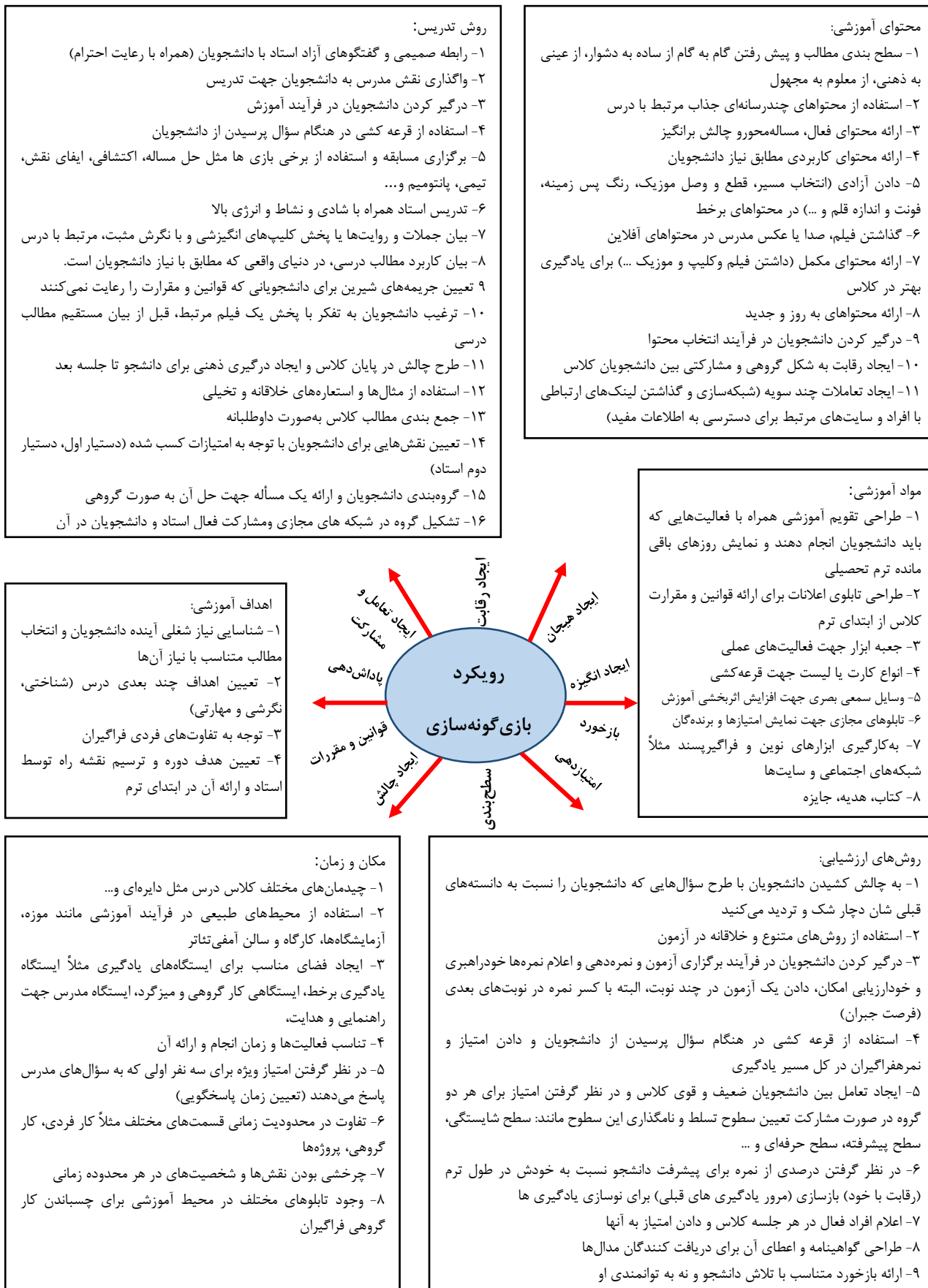
شکل ۱: ویژگی‌های برنامه درسی آموزش عالی براساس رویکرد بازی گونه سازی Fig. 1: Features of higher education curriculum based on gamification approach