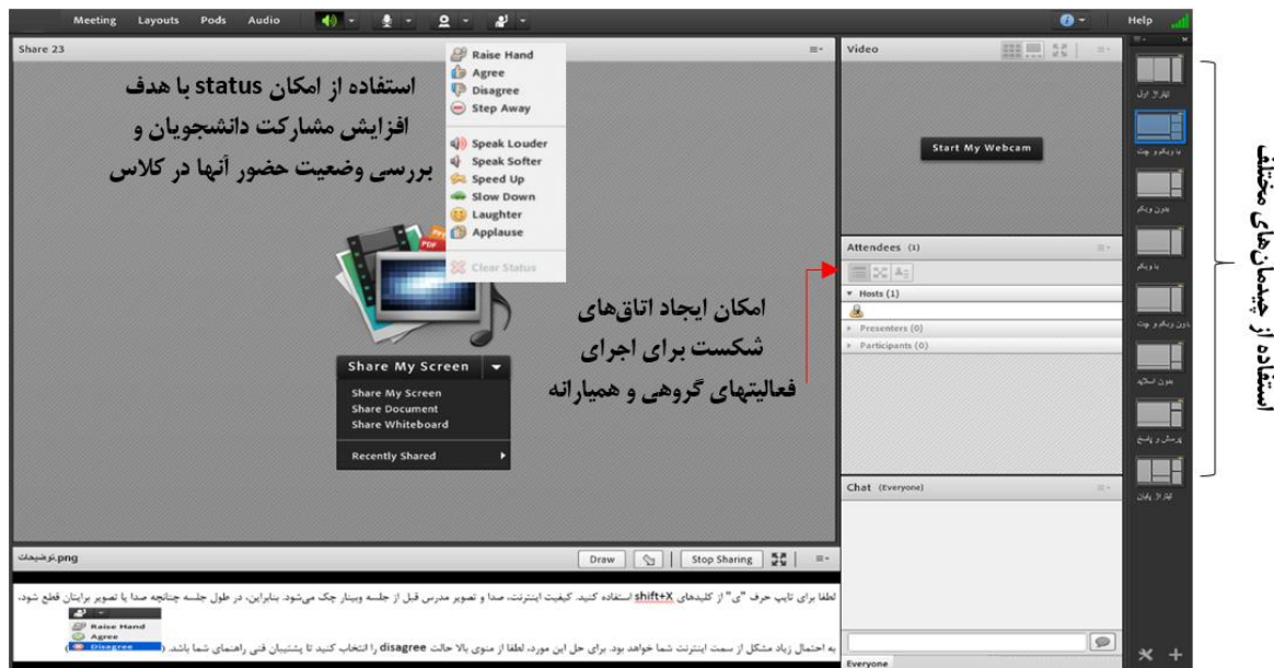
شکل ۱: برخی از اجزای نرم‌افزار ادوبی کانکت Fig. 1: Some components of Adobe Connect software

اشتراوس و کوربین، پس از تهیه رونوشت پژوهشگران جهت آشنایی با داده‌ها چندین بار آنها را بررسی کرده و چند ایده اولیه در مورد آنها ثبت کردند. سپس، به داده‌ها «کُد» اختصاص داده شد. در نتیجه کدگذاری، پژوهشگران «تم‌های انتزاعی» را که از تجزیه و تحلیل داده‌ها به دست آمد؛ شناسایی کردند و در پایان اعتباریابی یافته‌ها به روش بازبینی توسط همکاران انجام شد تا در مورد روش‌های ایجاد تعامل و کد اختصاص داده شده به آنها، توافق صورت گیرد. داده‌های مشاهده یا همان یادداشت‌های میدانی (Field notes) علاوه بر این که به صورت توصیفی از رویدادها، فعالیت‌ها، محیط، و افراد (یعنی آنچه روی داده است) ثبت شدند؛ در مورد آنها تأمل (معنایی که مشاهده‌گر از موقعیت، و افراد دارد) نیز صورت گرفت [۲۱]. در جدول ۲ نمونه‌ای از یادداشت توصیفی و تأملی پژوهشگر حین مشاهده کلاس مجازی، ارائه شده است.