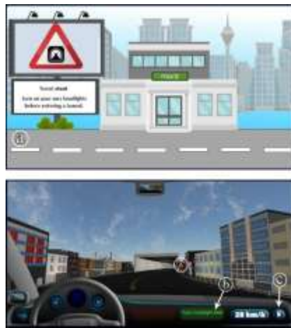
شکل ۳: الگوریتم بازی گروه کنترل (محتوای متنی-تصویری) Fig. 3: Game algorithm in control group (Visual and text –based content)

با توجه به سطح معنی‌داری آزمون لوین ( ۰/۰۰ )، که کمتر از مقدار ( ۰/۰۵ ) است؛ مفروضه برابری واریانس دو گروه رد شده و جهت گزارش نتایج تحلیل t مستقل، از داده‌های خروجی سطر دوم جدول استفاده شد. نتایج جدول ۴ حاکی از آن است که میانگین تعداد قوانین نقض شده به‌واسطه گروه آزمایش که توسط مدرس مجازی آموزش دیده‌اند ( M=۵/۰۰ )، در مقایسه با گروه کنترل ( M=۸/۰۰ ) کمتر بوده و در نهایت میزان یادگیری گروه آزمایش بیشتر است. بنابراین با ضریب اطمینان ۰/۹۵ و سطح معناداری ( ۰/۰۴۳ ) که از مقدار پیش‌فرض ( p<۰/۰۵ ) کمتر است، مشاهده می‌شود که بین تعداد قوانین نقض شده در دو گروه تفاوت معناداری به نفع گروه با عامل آموزشی وجود دارد. بنابراین فرضیه اول تأیید می‌شود.