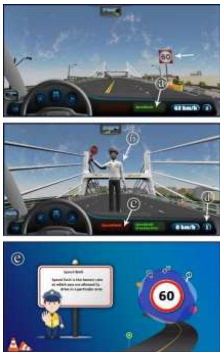
شکل ۱: الگوریتم بازی گروه آزمایش (محتوای مربی محور) Fig. 1: Game algorithm in experimental group (Virtual instructor -based content)

در نهایت، در مرحله پس از انجام بازی توسط دو گروه، پرسش‌نامه‌ای جهت اندازه‌گیری حس حضور در اختیار آن‌ها قرار گرفت. تعداد قوانین نقض شده توسط تمامی شرکت‌کنندگان نیز پس از اتمام بازی ذخیره شد و برای مقایسه سطح یادگیری مورد بررسی قرار گرفت.